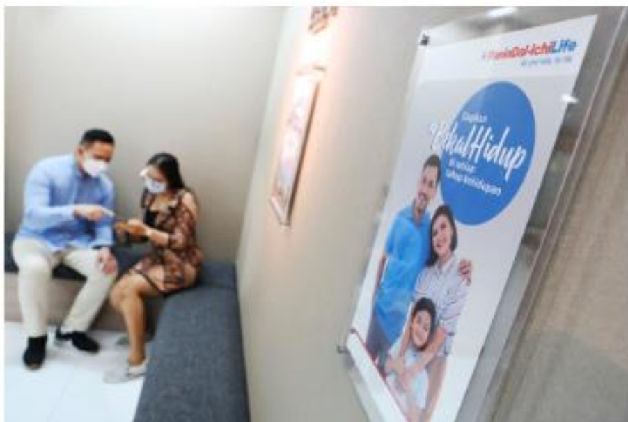
Rasuliani asuransi jiwa.

Jakarta, Beritasatu.com - Memiliki asuransi merupakan langkah penting dalam merencanakan masa depan yang aman dan terjamin. Asuransi memberikan perlindungan finansial terhadap berbagai risiko yang mungkin terjadi, seperti kecelakaan, penyakit, atau kerusakan properti.